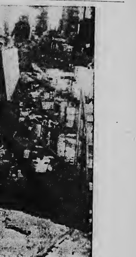
Esaki ta loke a pasa ora cu un dak di un drugstore na South Bend, Indiana, a colaps. Siete persona a bai hospital cu danjo na diferente parti di nan curpa.

Damantan di honor y strooisters a companja e bruid for di cas te na misa y despues trobe pa cas di e bruid. Bistir di bida y tambe di e acompañadonan, tabata mashar di luho. Nos ta desea e parcha recien casa aki hopi anja di bida y salud den union di nan amistadnan.